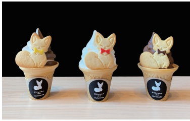
※子供価格は小学生以下が対象です

※各イベントで実施日や注意事項が異なります。詳細は「ぶらやま」で販売されている各チケットよりご確認ください。※写真はイメージとなります。